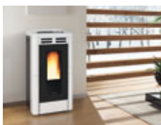
STUFE A PELLETT