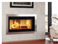
CAMINI A LEGNA