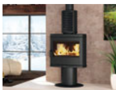
STUFE A LEGNA

Scopri tutti i modelli a legna e a pellet La Nordica-Extraflame che soddisfano i requisiti del Conto Termico 2.0 e calcola quanto puoi risparmiare.